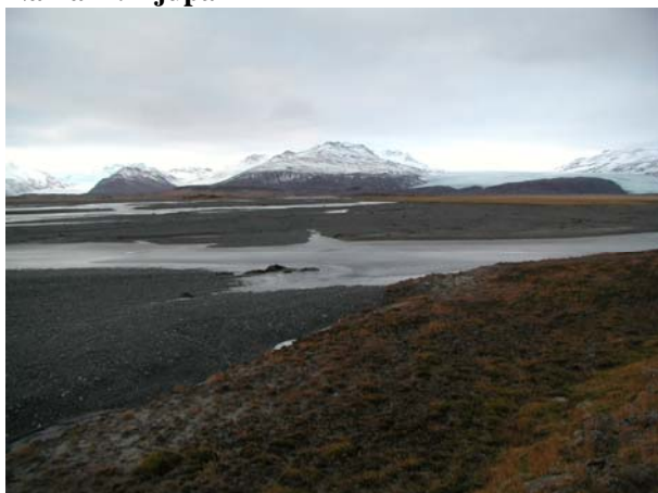
Mynd B.2. Áreyrar Djúpár

Áætluð efnistaka er í ógrónum áreyrum Djúpár.