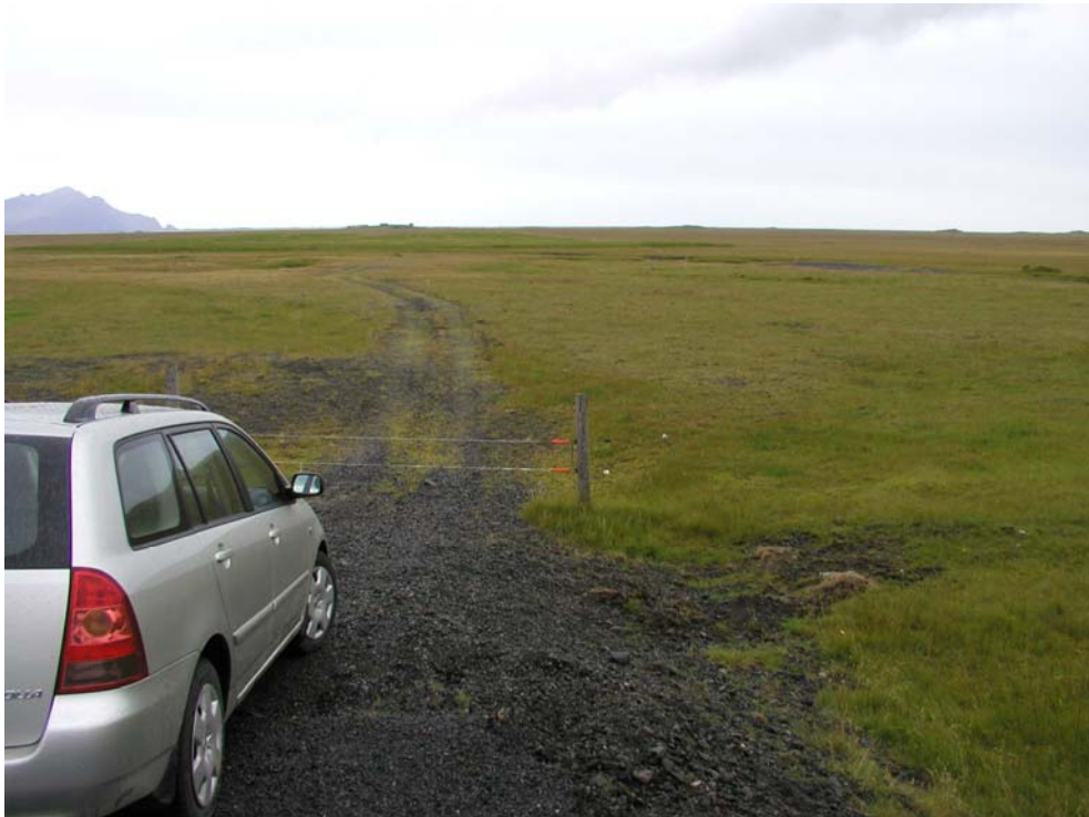
Mynd 2. Mýrar, Vesturhorn í baksýn til vinstri. Land er almennt flatt og gróið.

Berggrunnur á Mýrum er myndaður af basískum eða ísúrum hraunum frá tertíer, eldri en 3,1 milljón ára (Helgi Torfason, 1985). Berggrunnurinn er að mestu hulinn jökulaurum/söndum en þó má víða sjá klapparholt upp úr jökulaurunum. Holtin eru jökulsorfin auk þess sem sjór hefur slípað þau til (Hjörleifur Guttormsson, 1993). Þar sem holtin standa hærra í landi hefur búseta á Mýrunum verið að mestu bundin við þau því þar er ekki hætta af flóðum (Jóhanna Katrín Þórhallsdóttir & Rannveig Ólafsdóttir, 2004).