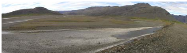
Mynd b.4. Austurfljót. Horft upp með farvegi Austurfljóts.