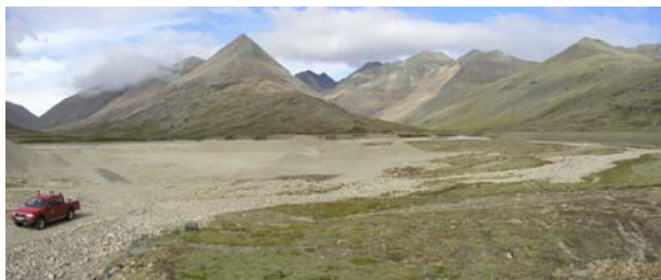
Mynd B.9. Náma 9 er í mynna Slaufudals sem sést á miðri mynd. Náman er í notkun og eru malarhaugar í henni.