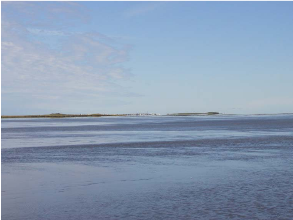
Mynd 3. Horft yfir Hornafjarðarfjót, Skógey og Höfn í baksýn.