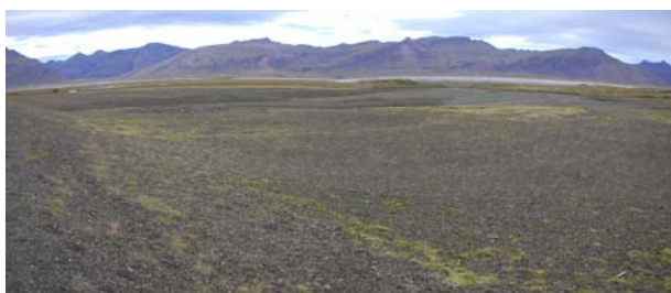
Mynd B.3. Grjótá

Efri myndin sýnir efnistöku svæðið fyrir ofan veg en sú neðri sýnir efnistökusvæðið fyrir neðan veg.