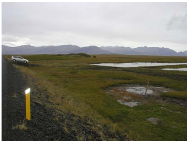
Mynd B.10. Náma 10 er á flötu landi fyrir miðri mynd. Tjörn sem er við veginn eru leifar af gamalli efnistöku.