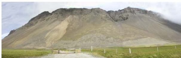
Mynd B.7. Friðsæld, náman er í skriðum og aurkeilu. Burðarlag verður tekið í skriðum vinstra megin en fyllingar í aurkeilu hægra megin á myndinni.