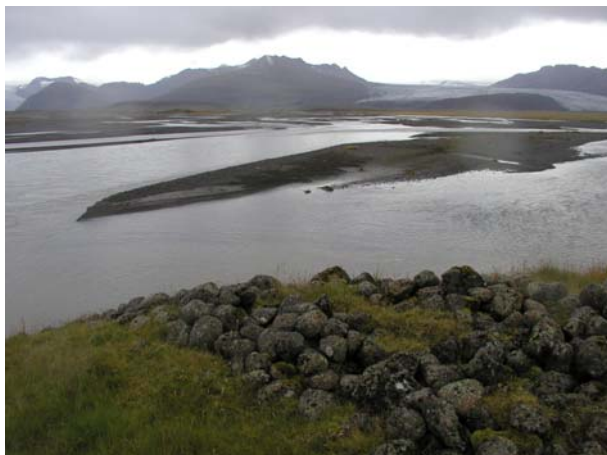
Mynd B.1. Hólmsá

Náma 1 er í lítt grónum áreyrum og árfarvegi Hólmsár.