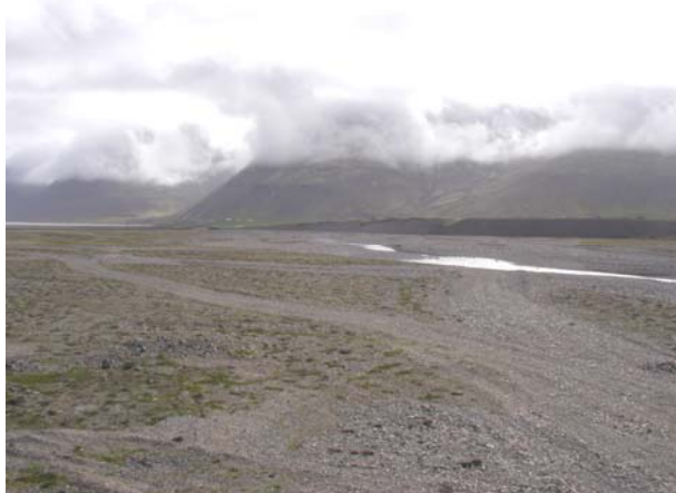
Mynd B.8. Áreyrar Fjarðará, að mestu ógrónar.