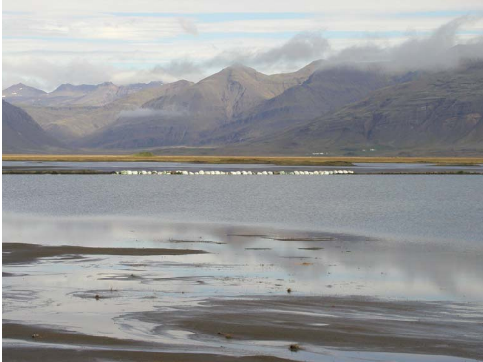
Mynd 4. Varnargarðar fyrir norðan Skógey. Gamlar heyrúllur notaðar til að hindra að vatn flæði inn á gróin svæði.