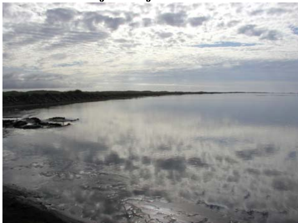
Mynd B.5. Hornafjarðarfljót, horft niður með Skógey. Efnistaka mun fara fram í farveginum.